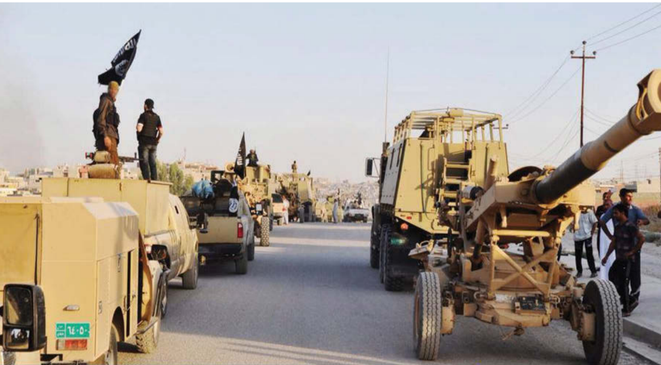
ولاية نينوى | استعراض للدولة الإسلامية في مدينة الموصل

استغرب سكان مدينة الموصل من الاستعراض الذي نظمه تنظيم داعش بمشاركة العشرات من سياراته في شوارع مدينتهم وبمظاهر مسلحة من دون ان يتم استهدافه بالطائرات. وقال شهود عيان ان "تنظيم داعش نظم استعراضاً عسكرياً بمشاركة اكثر من 50 سيارة بيك أب نوع شوهر ليت كانت تابعة للقوات الامنية، إضافة الى سيارات مدينة اخرى، وكان المسلحين يخرجون انفسهم من نوافذ السيارات وهم يحملون الاسلحة ويشبهن لافيت". وبيّنوا ان "الاستعراض استمر لثمن طويلاً انتقل بين مختلف وشوارع الموصل بجانبها الشرقي والغربي، مضيفين "لنا نسمة ونشاهد افلام فيديو واخبار عن غارة امريكية على داعش او تجمع بعض افرادهم في مناطق مختلفة من العراق وكوياتي في سوريا، لكننا نستغرب من عدم استهداف الاستعراض الذي كان يضم قوات كبيرة في الموصل مع العلم ان الطائرات الامريكية وكذلك العراقية لا تنفك عن التحليق في سماء الموصل". واوضحوا ان "هذا يدعو لامرئين الاول ان ادعاء تلك القوات بالمراقبة الجوية لداعش امر فيه مبالغه وتهويل، او ان تلك القوات غير جادة بتوجيه ضربات موجعة لداعش وانقاذنا منهم بقدر ما تكون ضرباتها ذات تأثير تتعلق بمصالح امريكا وإن الموصل خارج الاهتمام بالوقت الحاضر". وتابعوا "والامر الملفت للانتباه في هذا الاستعراض انه يختلف عن باقي