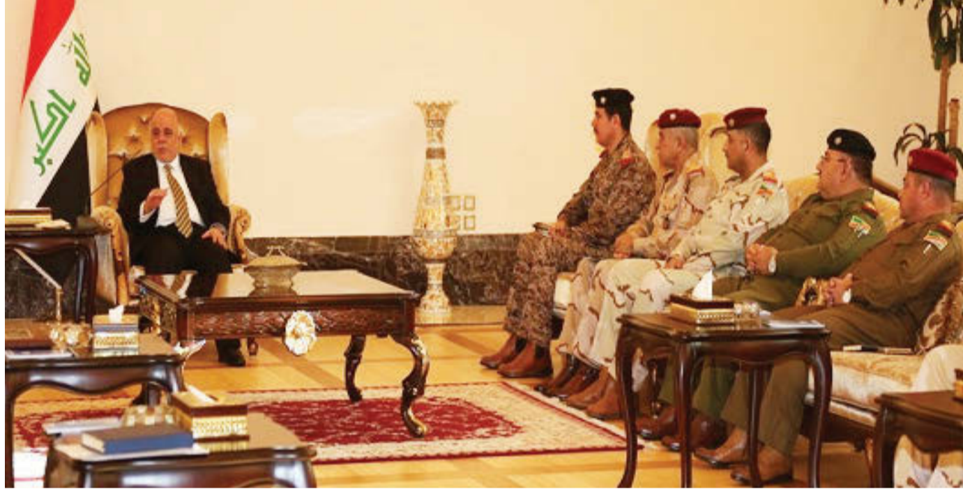
في ظل وجود تجهيزات عسكرية حديثة بحوزة القوات الامنية كان سببا في سقوط هذه المدن. محافظات أخرى. وكرت القوى السياسية أن تخاذل القادة وعدم مواجعتهم مئات الأفراد من التنظيم داعش الوهابي في وزارة الدفاع والداخلية بعد أحداث العاشر من يونيو 2014، وسيطرة على الموصل وأجزاء من

وصل وزير النفط في الحكومة الاتحادية العراقية عادل عبد المهدي، اليوم الخميس، الى اربيل لاجراء مباحثات مع المسؤولين في حكومة اقليم كردستان حول الخلافات بشأن النفط. وقال ان عبد المهدي توجه فور وصوله الى مقر مجلس الوزراء في حكومة الاقليم. ومن المقرر ان يبحث عبد المهدي مع كبار المسؤولين في الاقليم ملف تصدير النفط الكوردي الذي يشكل العقدة الاكبر في طريق تطبيع العلاقات بين اربيل وبغداد.